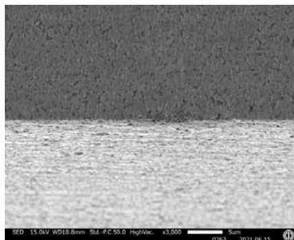
Fig. 2 After ion beam sputtering