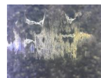
Fig. 3 Picture of dirt.

製品層内に付着した汚れを Fig. 3 に示す。この汚れを赤外顕微反射法を用いて成分分析を行ったところ、ウレタンと成分が一致した。異物同様に自社にて使用しているウレタンローラーとピークを比較したところ、汚れと成分が一致した。このため、製品層内の付着した汚れは自社内のウレタンローラーが原因であると考えられる。また、Low-E ガラスに付着した汚れは前処理せずに、分析することができた。