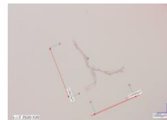
Fig. 1 Picture of defect.

製品層内に付着した異物を Fig. 1 に示す。この異物を ATR 法を用いて成分分析を行ったところ、ウレタンと成分が一致した。自社にて使用しているウレタンローラーを分析したところ、異物と成分が一致した。異物とウレタンローラーのピークを比較したものを Fig. 2 に示す。このため、製品層内の付着した異物は自社内のウレタンローラーが原因であると考えられる。