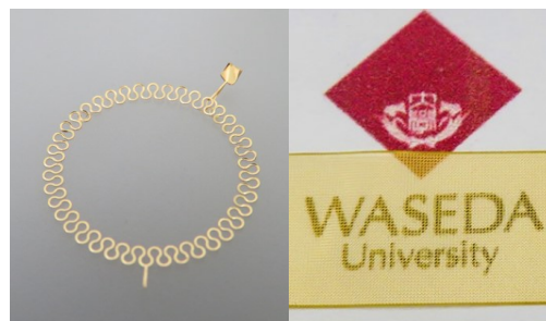
Fig. 1 Pictures of Au wave antenna (left), and Au mesh electrode (right).

一方、Fig.2 にナノストローメンブレンの SEM 画像を示す。ポリカーボネート基板のエッチング後、マイクロスケールの高さを持ったナノストローを作製することに成功し、またその高さを自在に制御することにも成功した。