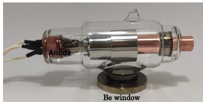
Fig. 1 Prototype X-ray tube with Be window

Fig. 2 に陽極電流の陽極電圧依存性を示す。冷陰極を用いているので陰極からのエミッション電流が空間電荷の影響を受けにくく、10 KV 程度までは高圧/陽極電流 (KV/Ia) 依存性がほとんど無い。実際に陽極電圧を 30 KV から 10 KV まで低下させても陽極電流特性が変わらないことを確認できた。