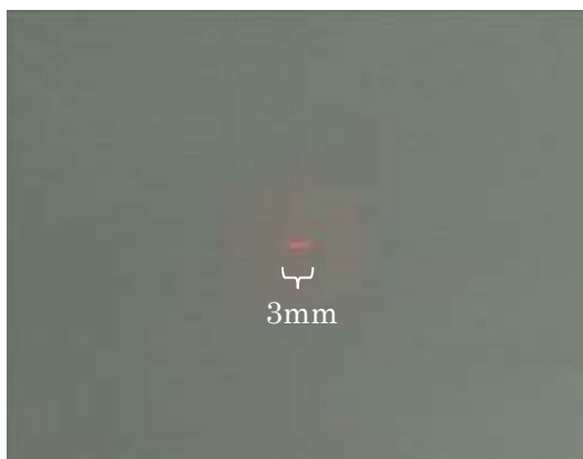
Fig. 3 Focused line shape by DOE

Fig. 3 は、作製した回折光学素子に He-Ne レーザーを入射し、拡大光学系を用いてスクリーンに投影した観察写真である。直線状にレーザー光が集光されていることが確認できた。